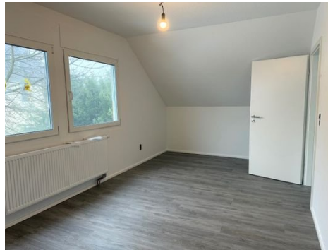
1. Zimmer OG