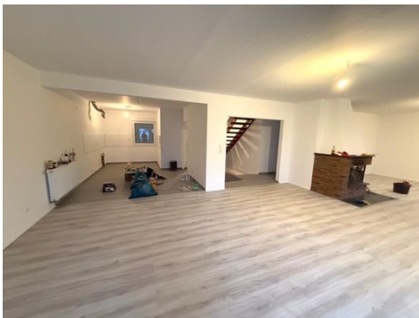
Wohnzimmer mit Blick in Küche und Flur