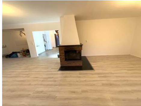
Wohnzimmer mit Blick in Flur und Küche