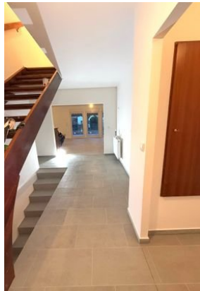
Flur mit Gaderobe rechts