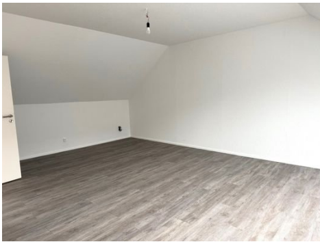
2. Zimmer OG II