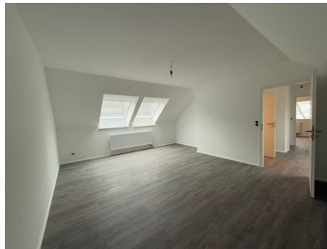
2. Zimmer OG